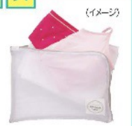
衣類がそのまま洗える収納ポーチ3点セット